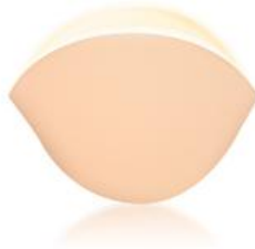
3017042 kliniderm foam heel steril – 5 Stück ; PZN 09517319