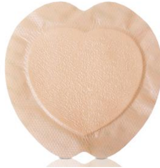
KLINIDERM FOAM BORD SACRAL *S*