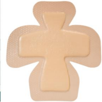
3037336 Kliniderm foam silicone heel bprder 20X20,8CM - 5 Stück ; PZN 13154472